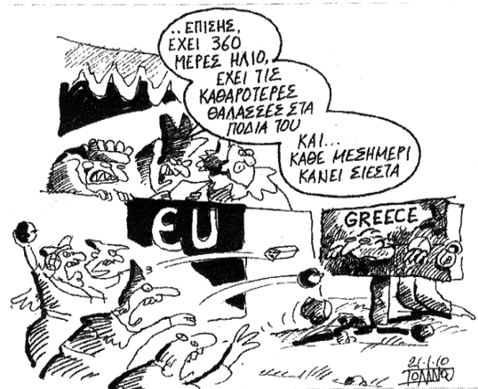
Του ΓΙΑΝΝΗ ΙΑΝΝΟΥ από το «ΕΘΝΟΣ».

Ακόμη και την παγκόσμια κρίση του ευρώ, εμμέσως, σχεδόν μας χρέωσαν. Έχουμε αλήθεια, αυτή τη δύναμη; Η μικρή "ψωροκώστανα" με την τεράστια ζεστή αγκαλιά, με όλες τις δυνατότητες και αδυναμίες της, μπορεί να επηρεάσει την παγκόσμια οικονομία; Να δημιουργήσει την κρίση που μαστίζει σήμερα όλη την οικουμένη;